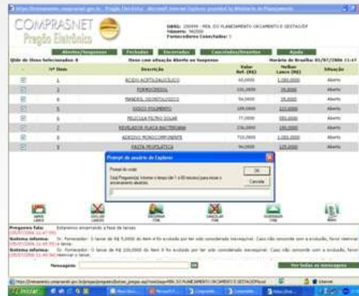
FASE 2 ENCERRAMENTO