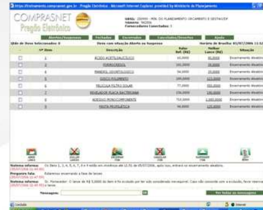
FASE 3 ALEATORIA