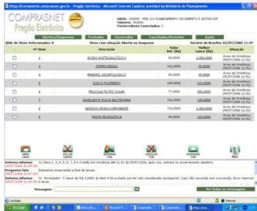
FASE 1 NORMAL

STATUS DE LANCES: REPRESENTA O QUE HOJE ACONTECE NA PRÁTICA NO PREGÃO ELETRÔNICO QUANTO ÀS OFERTAS APRESENTADAS PELOS LICITANTES DURANTE A "FASE DE LANCES". OS NÚMEROS ATRIBUÍDOS (1 a 10) REFEREM-SE À INTENSIDADE COM QUE SÃO INSERIDAS AS OFERTAS PELO LICITANTE NO SISTEMA, OU SEJA, À MÉDIA PROPORCIONAL DE LANCES OFERTADOS. ESCALA CRESCENTE DE 1 A 10